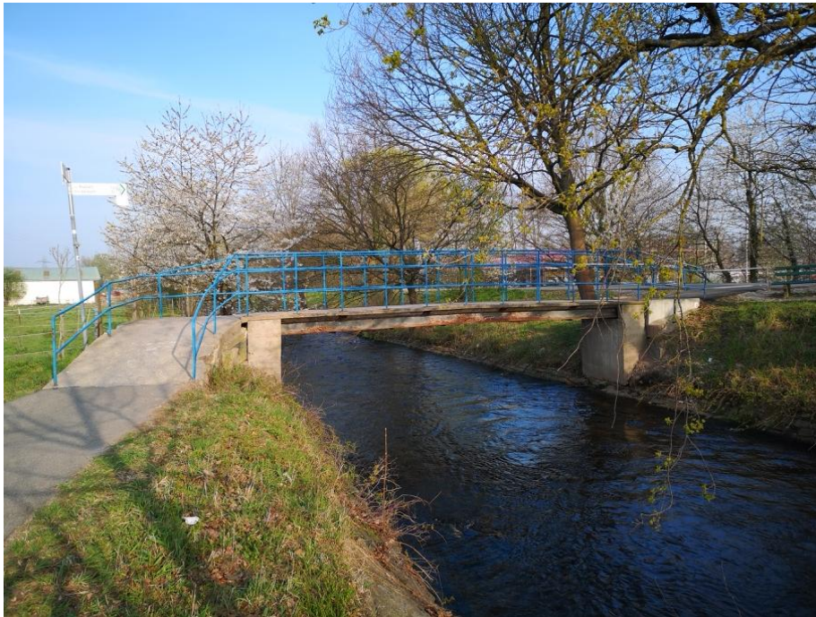
Bestehende Brücke über den Gewerbekanal, Blickrichtung Rastatt