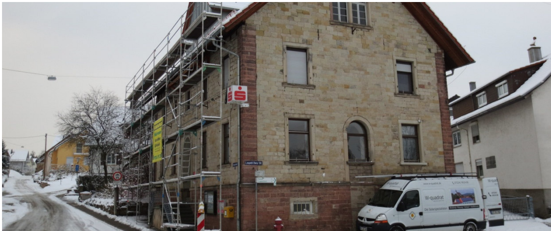
Die Firma W-Quadrat bei der Installation der neuen Anlage